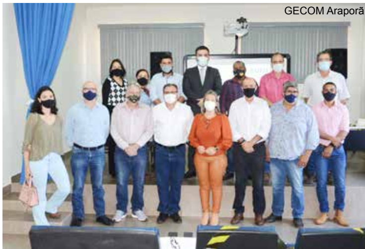
Apresentação do laudo técnico da UFU em Araporã

Os profissionais da UFU apresentaram algumas conclusões. A carga máxima da