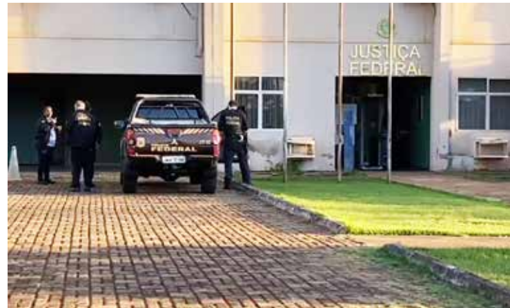
Sede da Justiça Federal, em Itumbiara, no Fórum

Segundo a PF, as investigações apontaram que os produtos contrabandeados do Paraguai - eletrônicos, medicamentos e cosméticos - abasteciam comércios em