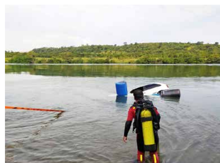
Veículo foi retirado pelo Corpo de Bombeiros

O veículo foi retido pela Polícia Militar e o caso agora será investigado pela Polícia Civil.