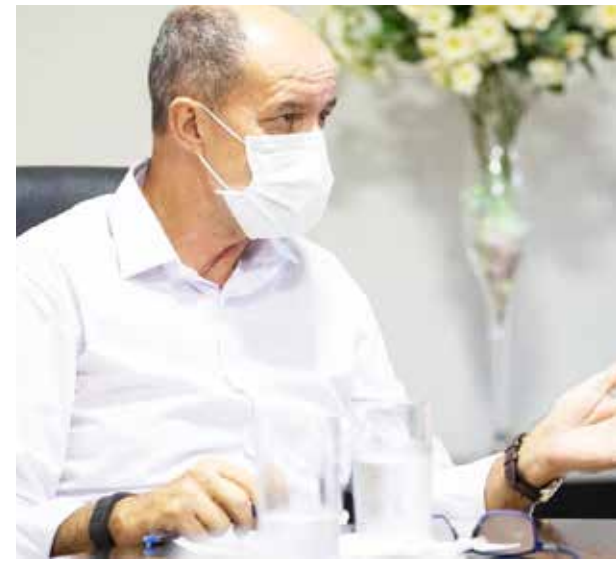
Dione Araújo: "Todos os setores da economia de Itumbiara contrataram em janeiro"

O mês de janeiro foi positivo na geração de empregos em Itumbiara. Segundo dados do Cadastro Geral de Empregados e Desempregados (CAGED), foram criadas 215 novas vagas de emprego formal no município. O sistema registrou 1.065 admissões e 850 desligamentos. Todos os cinco setores pesquisados (comércio, serviços, indústria, agropecuária e construção civil) tiveram saldo positivo na geração de empregos. A maior contratação aconteceu no setor de serviços (57 vagas), seguido pelo comércio (55), indústria (52), agropecuária (32) e construção civil (19). O prefeito de Itumbiara, Dione Araújo recebeu os números com entusiasmo e disse que acredita na recuperação da economia, porque todos os setores estão abrindo vagas e isso mostra que o empresariado está acreditando na cidade e fazendo um esforço para manter e expandir os negócios, mesmo diante da crise causada pela pandemia. Ele cita o andamento das obras da Comfrio e Corteva, na BR-452 (próximo à antiga Pioneer) e da Cetric, no DIAGRI, em investimentos de quase R$ 80 milhões. O prefeito afirmou que o município está atuando no auxílio aos pequenos empresários, para terem acesso a linhas de crédito oferecidas pelo Estado e tem mantido conversas para manutenção dos empregos e busca de novos investimentos.