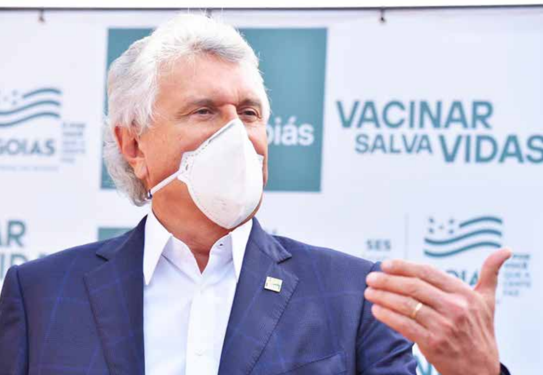
Governador Ronaldo Caiado: novo decreto será divulgado nesta terça, dia 30

O governador Ronaldo Caiado confirmou a reabertura do comércio na próxima quarta-feira (31/03). Nesta data, termina o prazo de 14 dias de fechamento de serviços não essenciais, estabelecidos no decreto que está em vigor no Estado desde 17 de março, com revezamento das atividades econômicas.