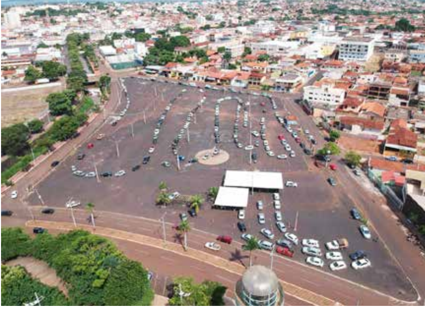
Vacinação no Capim de Ouro na última quinta-feira: quase 16 mil doses da vacina contra Covid aplicadas