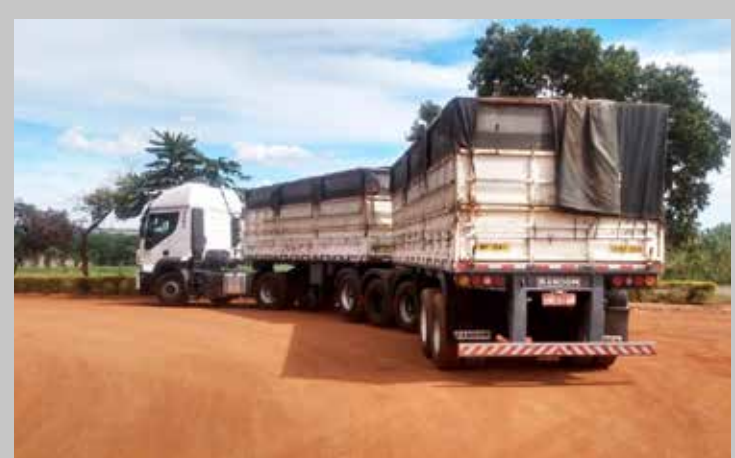
Carga recuperada foi avaliada em R$ 170 mil