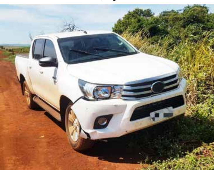
Caminhonete foi encontrada no Meia Ponte

Denúncias para a Polícia Civil e para o Gepatri podem ser feitas no telefone 64-34317282 ou 197 ou pelo e-mail gepatri.itumbiara@gmail.com.