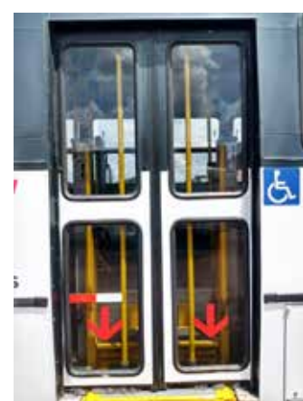
Rampa para pessoas com deficiência e rigoroso protocolo sanitário para todos os passageiros

COM A MÁSCARA EU PROTEJO VOCÊ E VOCÊ ME PROTEGE QUANDO CADA UM FAZ A SUA PARTE, VIDAS SÃO SALVAS.