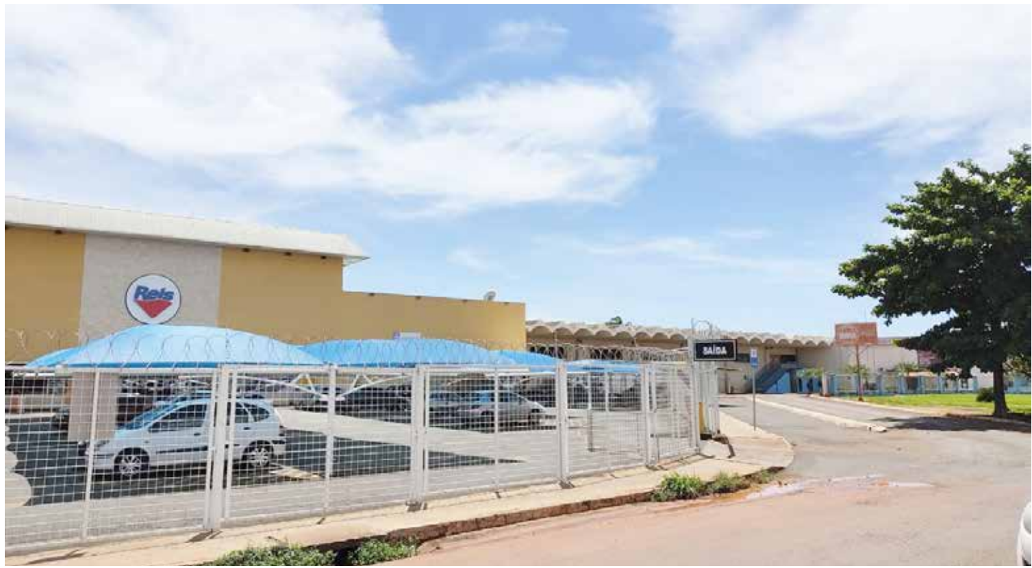
Terminal Rodoviário de Itumbiara é administrado pela Geoserv desde 2000, através de concessão pública

inclusive instauração de procedimento junto a 3ª Promotoria de Justiça de Itumbiara. No decreto nº 406/2021, publicado no Diário Oficial do Município em 23 de março, a Prefeitura alega ainda que a Geoserv não está cumprindo as responsabilidades previstas em contrato por inadimplência e danos causados ao erário municipal. A Secretaria Municipal de Administração e Recursos Humanos abriu o processo administrativo para investigar o contrato, para verificar se houve descumprimento dos termos contratuais. No processo será apurado os investimentos realizados pela Geoserv no terminal. Foram nomeados três servidores para análise e julgamento do processo administrativo.