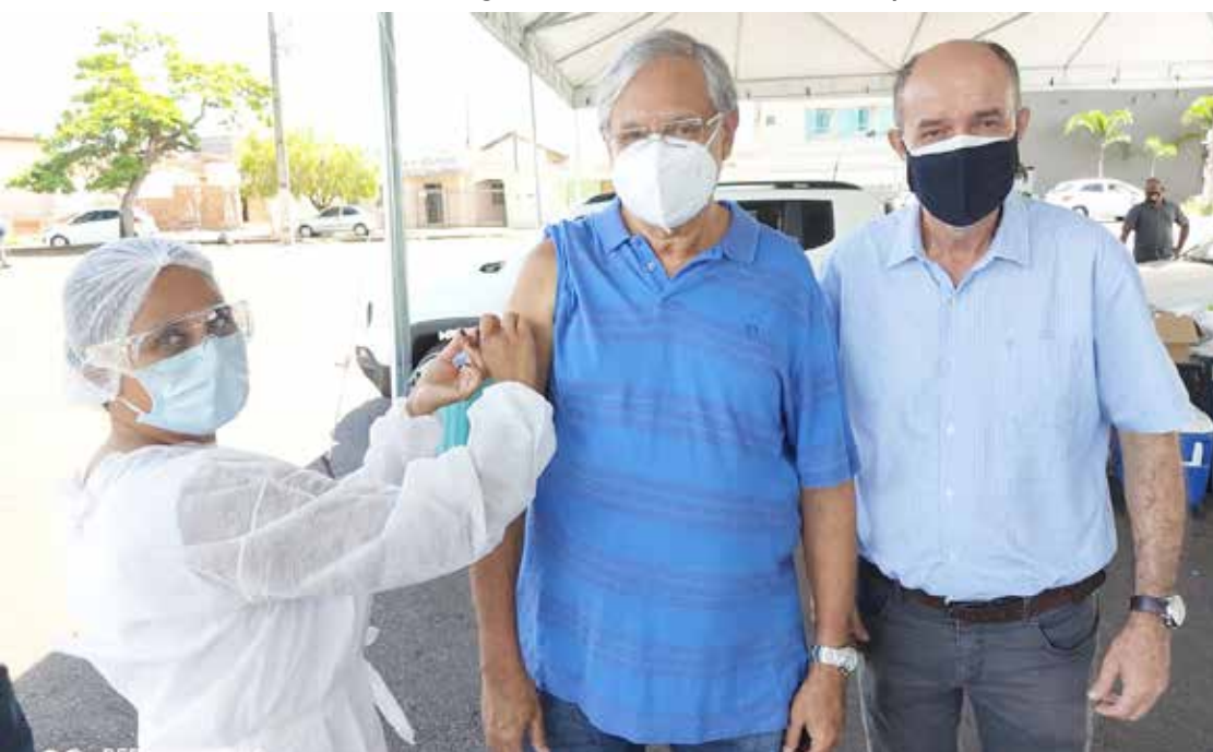
Ao lado do prefeito Dione Araújo, o Corregedor Geral de Justiça Nicomedes Domingos Borges é vacinado no Capim de Ouro, na manhã de quarta (24)

Mais de 10 mil pessoas já foram vacinadas contra a Covid-19 em Itumbiara e nesta semana estão sendo imunizadas pessoas com idade igual ou superior a 66 anos. Considerando a segunda dose, já foram aplicadas mais de 13 mil vacinas nos itumbiarenses, segundo a Secretaria Municipal de Saúde.