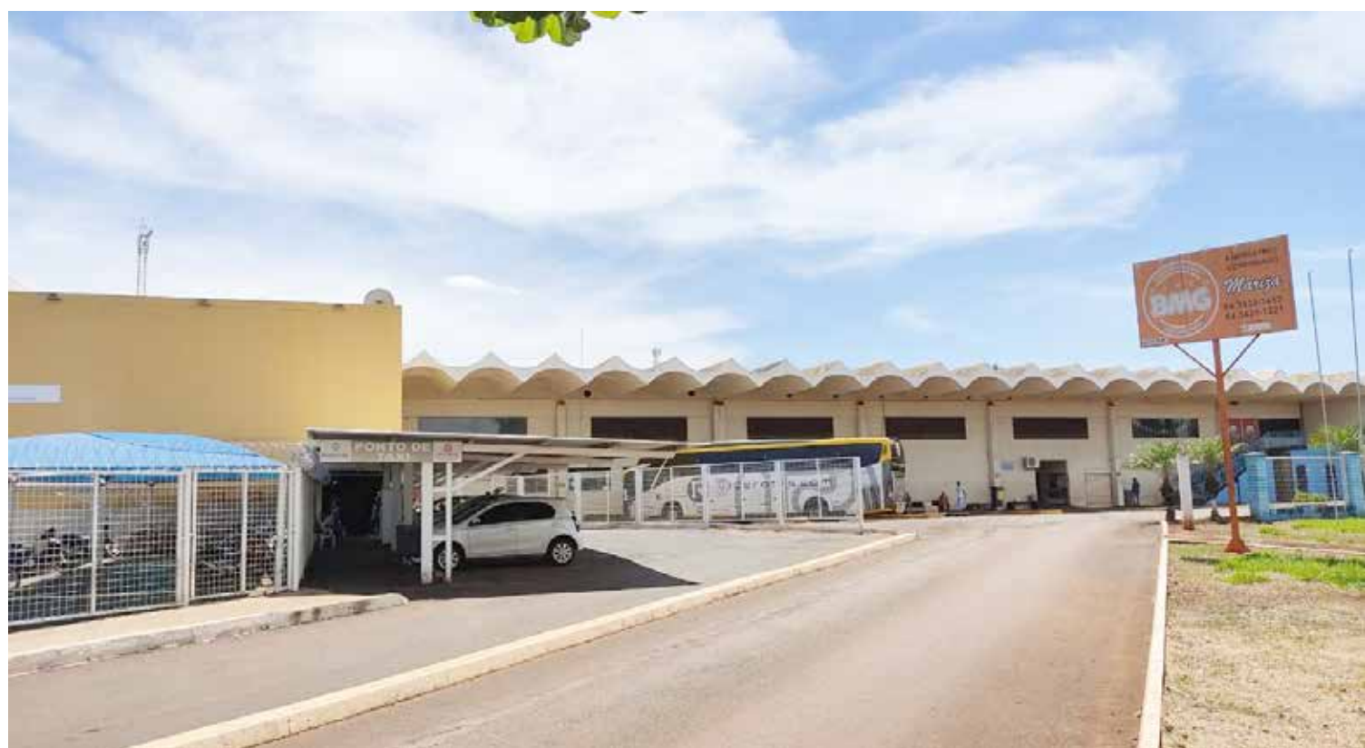
Geoserv administra o Terminal Rodoviário de Itumbiara, mediante concessão, há mais de 20 anos

O município de Itumbiara instaurou processo administrativo para análise do contrato de concessão para uso e exploração comercial do Terminal Rodoviário de Itumbiara. O município alega que a empresa Geoserv Serviços de Geotecnia e Construção vem descumprindo várias cláusulas do contrato, que foi firmado há mais de 20 anos. Segundo a Prefeitura, o contrato previa o repasse de 5% da arrecadação bruta do terminal ou 20% das receitas mensais, após deduzidas despesas administrativas e tributos, mas sempre prevalecendo a maior remuneração. Após inúmeras cobranças e notificações extrajudiciais contra a empresa, os valores não foram creditados, o que ensejou inclusive instauração de procedimento junto a 3ª Promotoria de Justiça de Itumbiara. Página 2