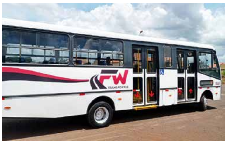
Operação inicia com dois micro-ônibus novos da FW Transportes