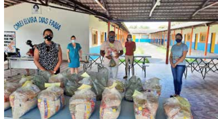
Distribuição dos alimentos atendeu todas as escolas e CMEIs da rede municipal em Itumbiara