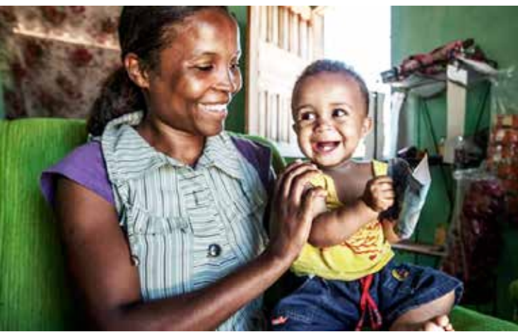
Para amenizar os efeitos da pandemia na parcela mais vulnerável da população, o governo de Goiás vai liberar os recursos para 237 municípios goianos

O Governo de Goiás por meio da Secretaria de Desenvolvimento Social (Seds) autorizou o repasse financeiro emergencial de recursos da ordem de R$ 28 milhões para a execução de ações socioassistenciais e de estruturação da rede do Sistema Único de Assistência Social (Suas) nos municípios goianos, como forma de amenizar os efeitos da pandemia junto à parcela mais vulnerável da população. Dos 246 municípios goianos, 237 (96%) já estão habilitados a receber