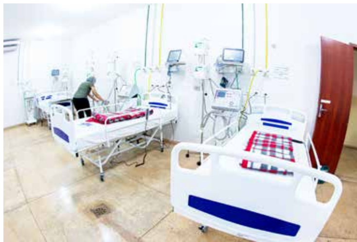
Dos 12 novos leitos, oito deles contam com recursos de UTI e equipe multidisciplinar para atendimento

O paciente com caso moderado ficará numa enfermaria, com acompa-