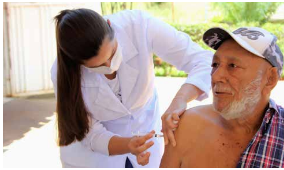
Buriti Alegre segue vacinando a população, de acordo com a disponibilidade de doses recebidas