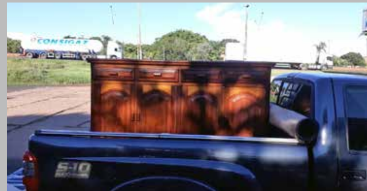
Mobiliário da casa e materiais de construção foram vendidos ilegalmente. Dois suspeitos foram presos