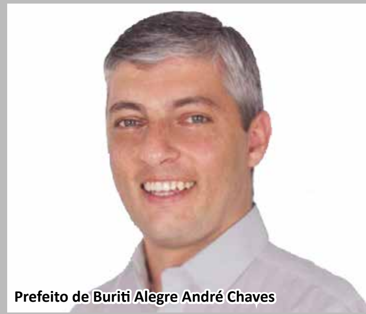
Prefeito de Buriti Alegre André Chaves