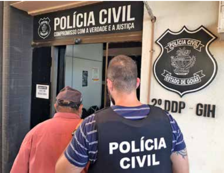
Crime foi cometido em 2007, homem foi condenado, estava foragido e agora irá cumprir a pena imposta

Mas o Grupo de Investigação de Homicídios (GIH) conseguiu encontrá-lo e deu cumprimento à ordem judicial. O condenado foi encaminhado ao Presídio Regional de Sarandi, onde deverá cumprir a pena, ficando à disposição do Poder Judiciário.