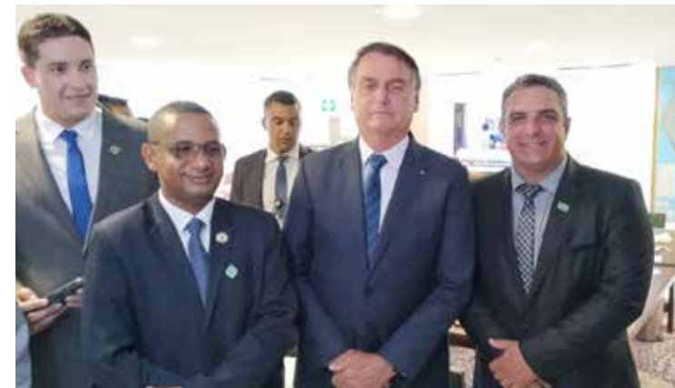
Prefeito de Cachoeira Dourada Rodrigo Rodrigues é recebido pelo presidente Jair Bolsonaro, em Brasília, durante o lançamento do Guia do Novo Prefeito Brasil