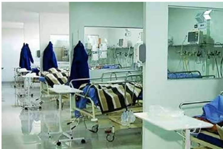
HCamp Itumbiara agora tem 30 leitos de UTI