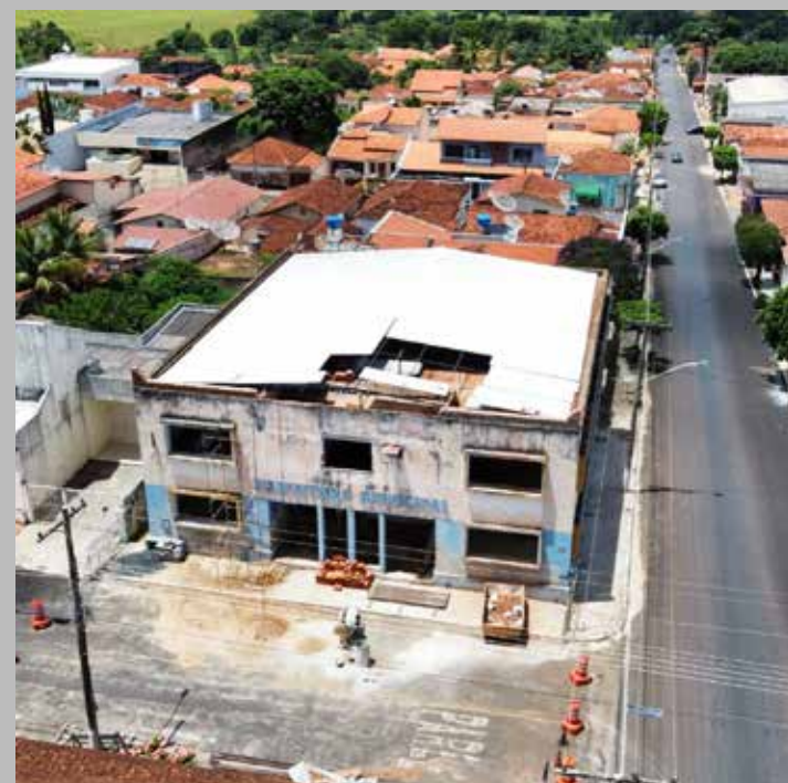
Troca do telhado e reforma de toda estrutura