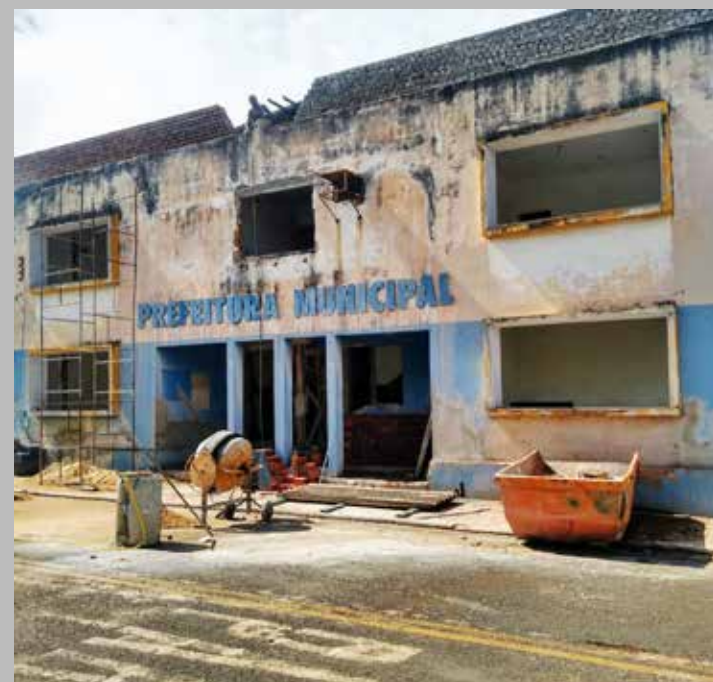
Paço municipal de Buriti Alegre em reforma