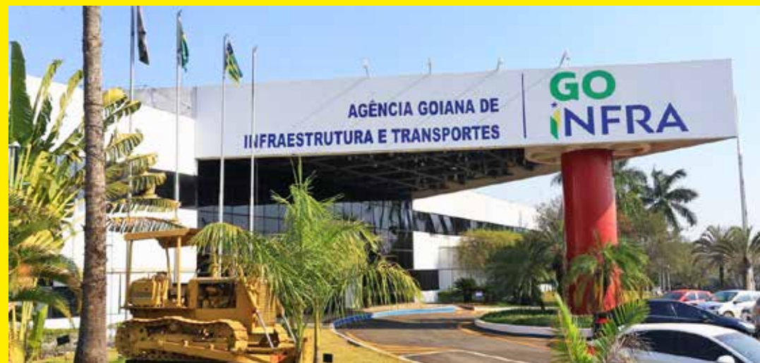
Goinfra oferece 140 vagas, com remuneração de R$ 4.665,82 mensais

Confira o edital e se inscreva pelo portal www.escoladegoverno.go.gov.br/selecoes/concursos-e-selecoes