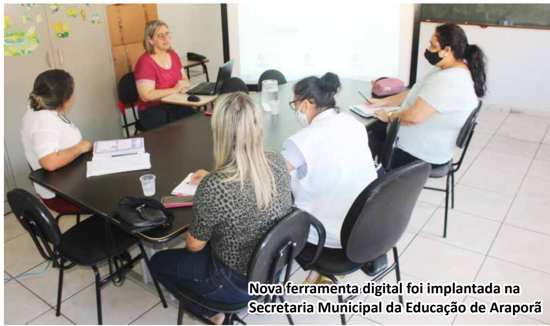
Nova ferramenta digital foi implantada na Secretaria Municipal da Educação de Araporã

O material pedagógico fica armazenado em nuvem e pode ser acessado pelo aluno e pelo professor a qualquer momento.