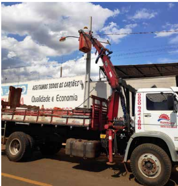
Reposição de lâmpadas: 542 trocas em janeiro

O funcionamento do Departamento de Iluminação Pública é de segunda a sexta-feira, das 7 às 11 horas e das 13 às 17 horas. Mas é feito um plantão à noite, das 18 às 20 horas, em ação pre-