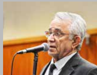
Deputado Estadual Álvaro Soares Guimarães

É uma alegria ver o nosso Deputado Álvaro assumir a 1ª Secretaria da Assembleia Legislativa. Temos certeza que vai trabalhar ainda mais por Itumbiara e todos os municípios de sua base. Parabéns Deputado!