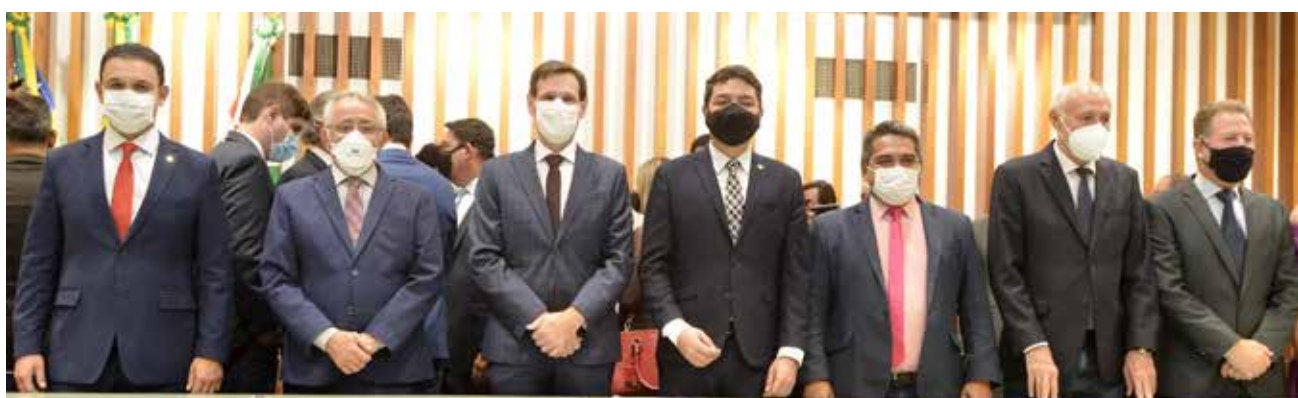
Membros da mesa diretora da Assembleia Legislativa para o biênio 2021/2023