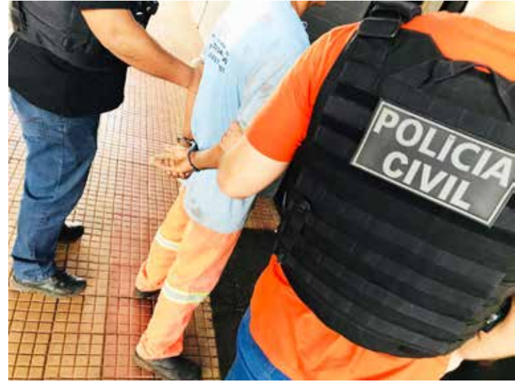
Autor do homicídio é preso de forma preventiva

A prisão se deu por ordem expedida pela autoridade Judiciária da comarca local. Após os procedimentos de