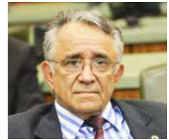
Álvaro Soares Guimarães Deputado estadual e 1º secretário da mesa diretora da Assembleia Legislativa, biênio 2021/2023

É uma alegria grande ver dois homens públicos como Dr. Nicomedes e o deputado Álvaro Guimarães galgando posições de destaque no Judiciário e Legislativo de nosso Estado. Parabéns, isso engrandece Itumbiara!