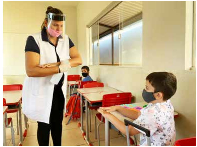
Protocolo rígido de segurança é seguido nas escolas de Araporã, no retorno presencial das aulas