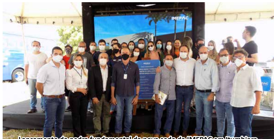
Lançamento da pedra fundamental da nova sede da IMEPAC em Itumbiara

O lançamento da Pedra Fundamental sinaliza uma nova e importante fase. A construção do complexo, com mais de 10.660 metros de área construída, proporcionará uma formação de excelência aos alunos, com qualidade técnica e docente aliada à tecnologia, e proporcionando a experiência profissional necessária.