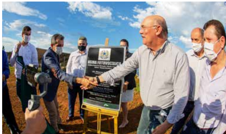
Dione cumprimenta o ministro da Educação Milton Ribeiro, deve visitar Itumbiara no próximo ano