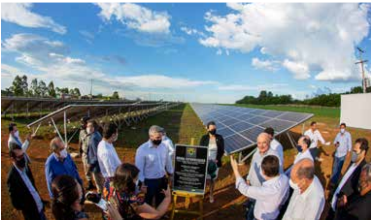
Inauguração da usina fotovoltaica no IF Goiano em Morrinhos, com o ministro da Educação Milton Ribeiro