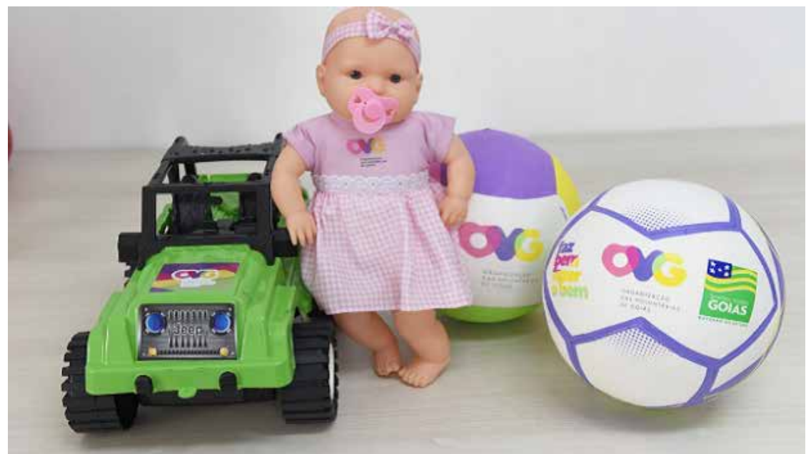
Brinquedos serão entregues para crianças em Itumbiara, no dia 18 dezembro: Escola Quim Machado (14h); e no CEPI Dom Veloso, Colégio Damores do Amaral, Colégio Polivalente, Colégio José Flávio e CEPMG Dionária Rocha, a partir das 8h

(Social) e na Escola Quim Machado, em Meia Ponte, a partir das 14h. A distribuição será feita pela equipe da Coordenadoria Regional da Educação (CRE) de Itumbiara, respondendo por Bom Jesus, Cachoeira Dourada e Buriti Alegre.