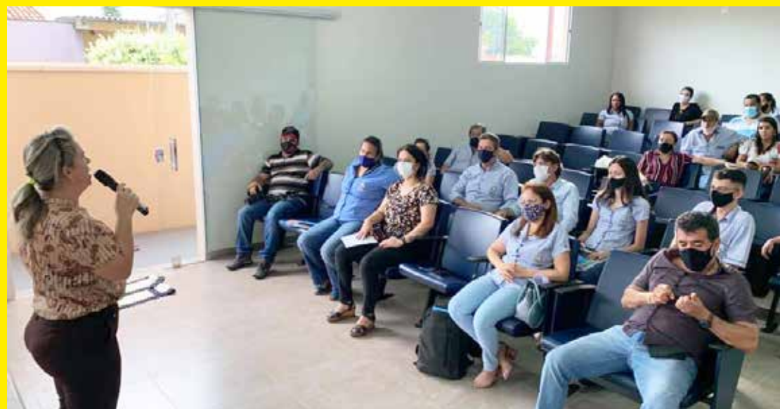
Prefeita Renata Borges durante reunião com equipe de trabalho em Araporã

Com cerca de 95% do plano de governo executado neste mandato, a avaliação foi satisfatória. "Quando fiz a escolha da minha equipe sempre me preocupei se a pessoa tinha o trabalho alinhado com os anseios do povo, porque meu governo sempre foi e sempre será voltado para a população,