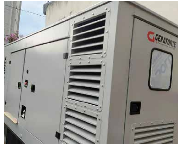
Gerador de energia de 300 kva

de Saúde é de que tudo esteja instalado e funcionando já no dia 23 de dezembro. O gerador menor que está atualmente em uso, de 150 kva, será dedicado exclusivamente para atender a tomografia, raio-x e mamografia, enquanto o novo atenderá o restante da demanda dos inúmeros equipamentos e aparelhos elétricos da principal unidade de saúde do Sul de Goiás, o Hospital Municipal Modesto de Carvalho.