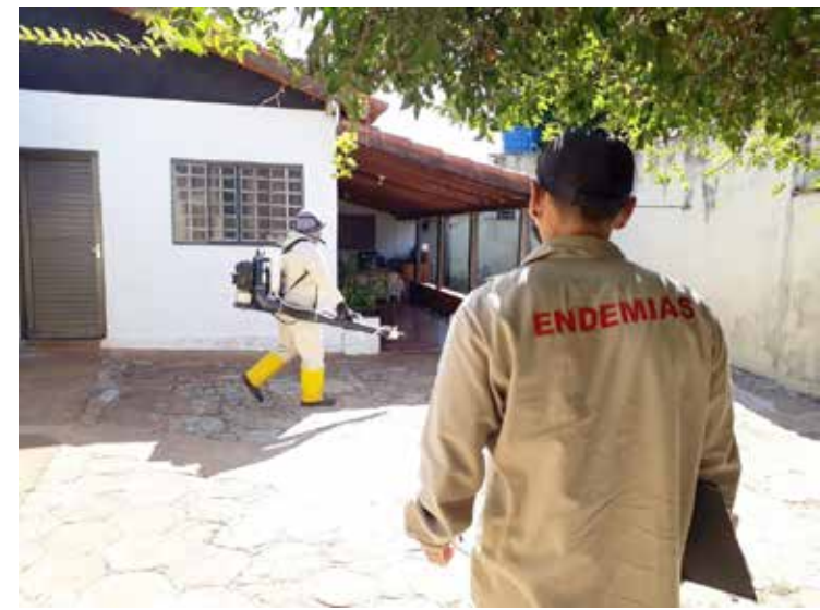
Agentes de endemias do município de Itumbiara

Instituído pelo novo Código de Processo Civil (CPC), o IRDR visa, justamente, enfrentar uma questão jurídica comum, pleiteada em várias ações distintas. Uma vez sedimentada a orientação jurisprudencial, o TJGO pode decidir, com segurança jurídica e isonomia, a respeito do tema. Cabe sempre ao Órgão Especial