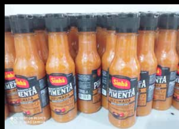
Molhos e condimentos Caipirão envasados com a marca Sinha, da Caramuru

A eleição para presidente da Câmara de Itumbiara segue sem maiores novidades. O pleito irá acontecer no dia 1º de janeiro, logo após a posse do prefeito, vice e vereadores.