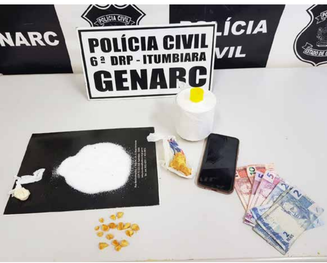
Drogas e insumos apreendidos pela Polícia Civil, através do GENARC

A pena para tráfico de drogas vai de 5 a 15 anos de reclusão e pode ser agravada diante da situação de reincidência da mulher. A Polícia Civil tem intensificado as ações de combate às drogas por meio do GENARC.