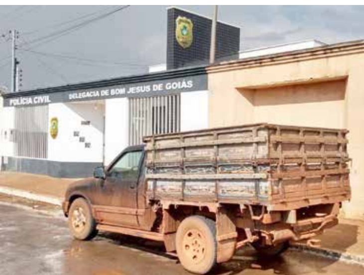
Delegacia de Bom Jesus