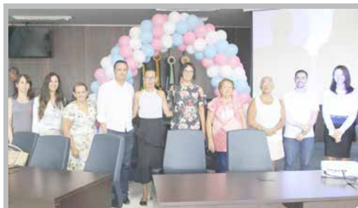
1º TRANSUL foi realizado na Câmara Municipal