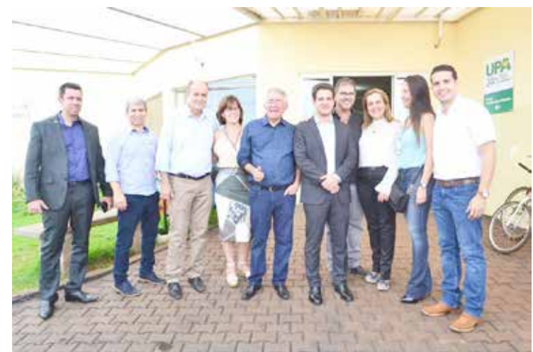
A comitiva formada por representantes do município e Estado visitou ainda a Unidade de Pronto Atendimento (UPA) no Bairro Juca Arantes