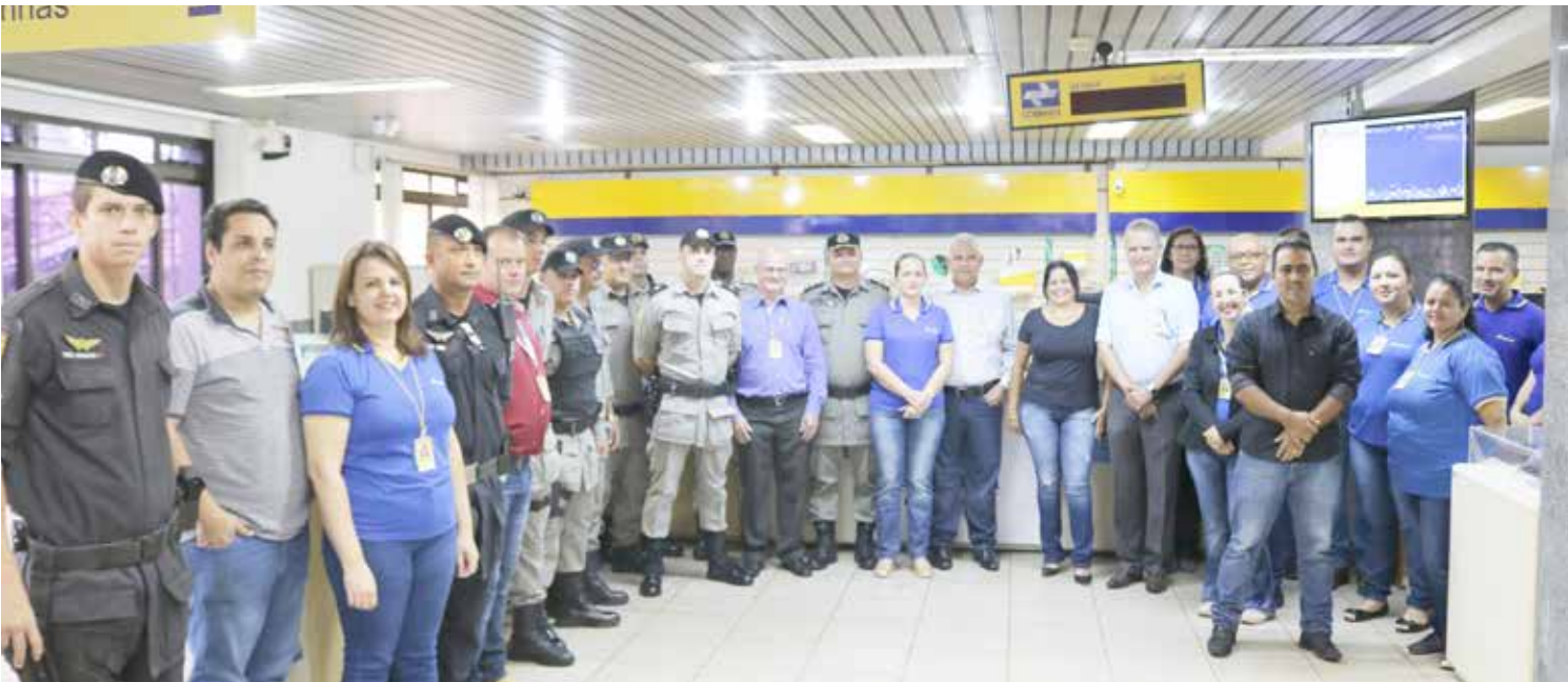
Policiais militares e funcionários dos Correios durante homenagem e café da manhã oferecido na agência central