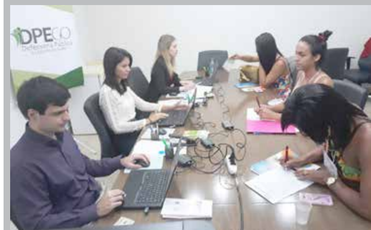
Defensoria Pública prestando atendimento