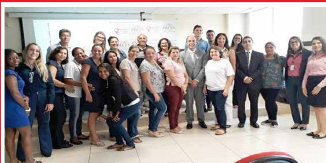
Reunião do Grupo Reflexivo em Itumbiara: projeto será implantado na Comarca